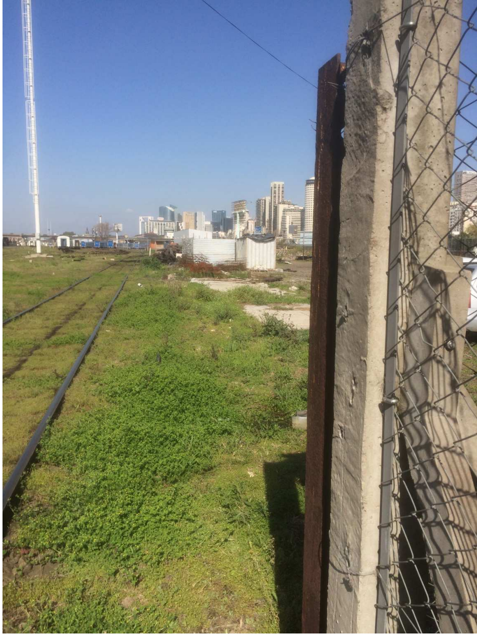
ANEXO FOTOGRAFICO – Ampliación y mejoras de cocheras en material rodante – Taller de locomotoras- Retiro