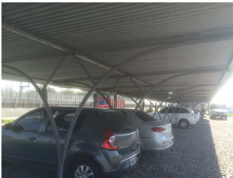
ANEXO FOTOGRAFICO – Ampliación y mejoras de cocheras en material rodante – Taller de locomotoras- Retiro