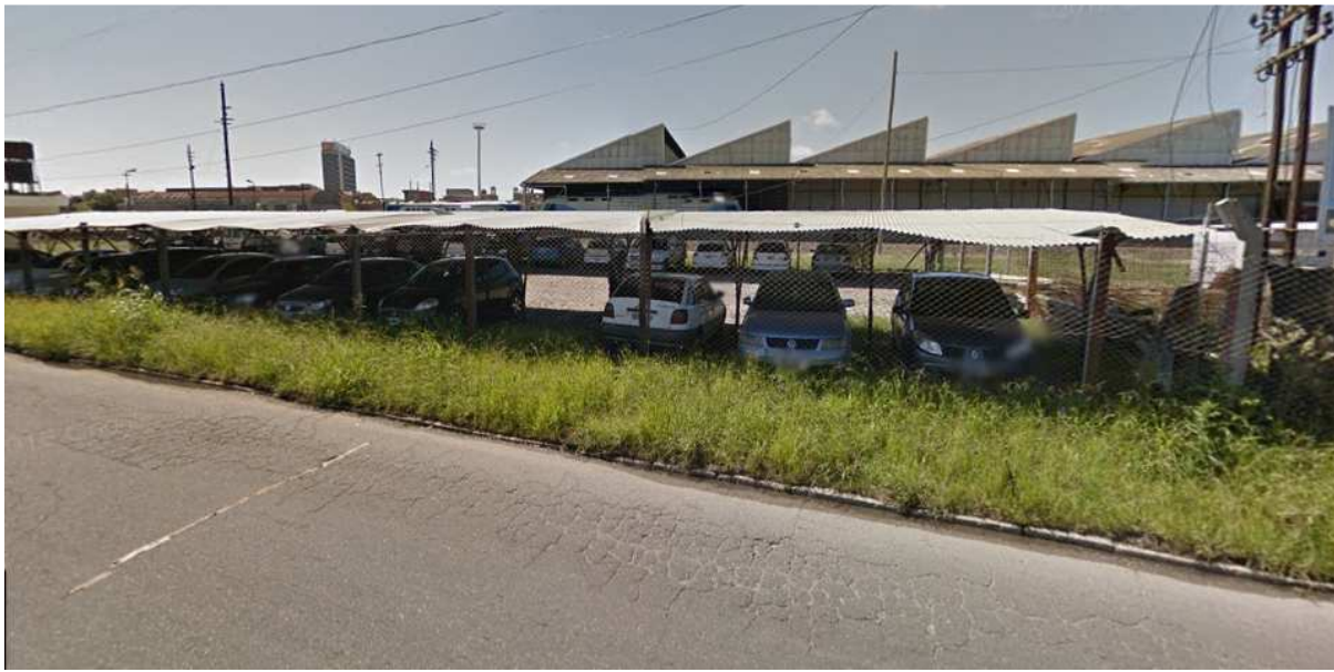
ANEXO FOTOGRAFICO – Ampliación y mejoras de cocheras en material rodante – Taller de locomotoras- Retiro