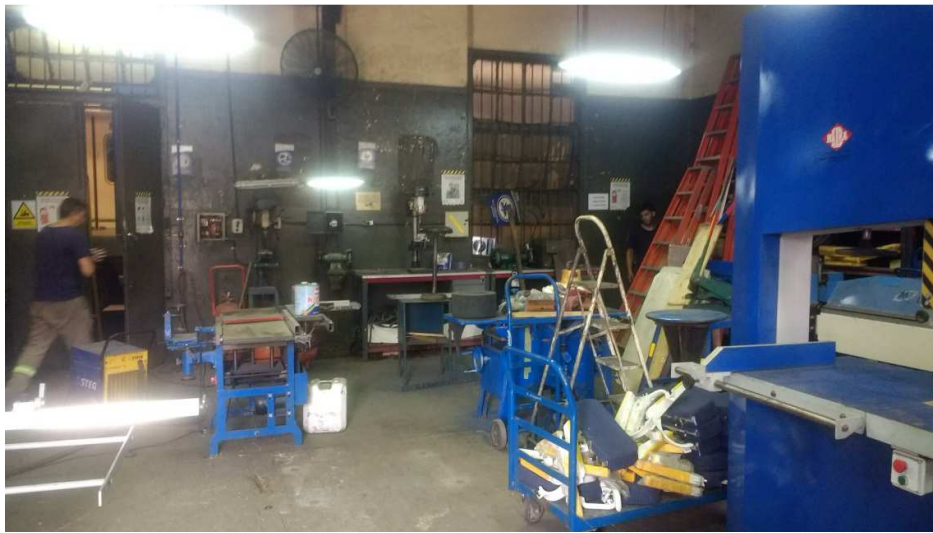
ANEXO FOTOGRAFICO – Trabajos en Taller de Coches (pintura, instalación neumática e instalación eléctrica) Sector Neumática, Carpintería, Electricidad y Fosas Taller. – Predio Retiro – LÍNEA SAN MARTÍN