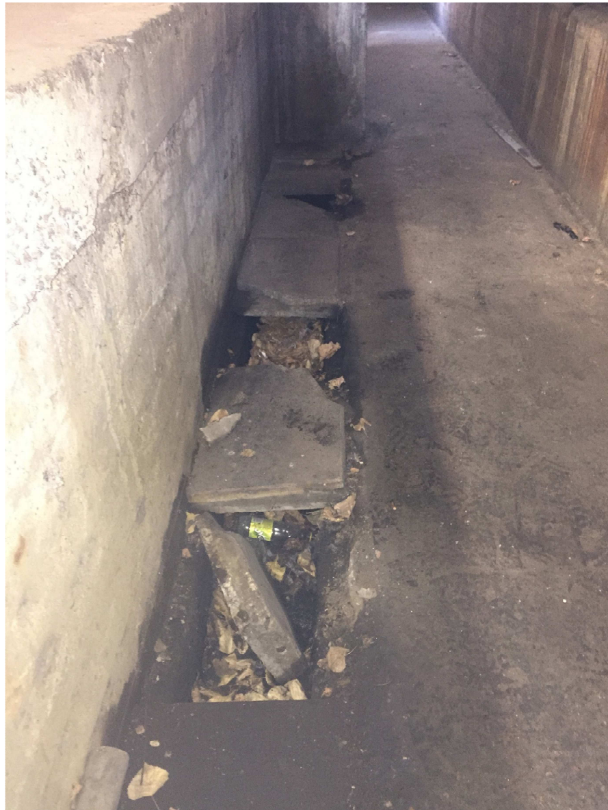
FOSA VIA 1 - LOSETAS DE HORMIGON A REEMPLAZAR

ANEXO FOTOGRAFICO - MEJORAS EN TALLER COCHES RETIRO - FOSAS Y CAMINO EXTERIOR - LÍNEA SAN MARTÍN