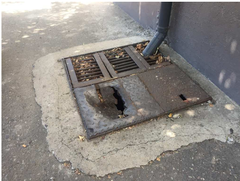
CAMINO EXTERIOR – TAPAS A REEMPLAZAR

ANEXO FOTOGRAFICO – MEJORAS EN TALLER COCHES RETIRO – FOSAS Y CAMINO EXTERIOR - LÍNEA SAN MARTÍN