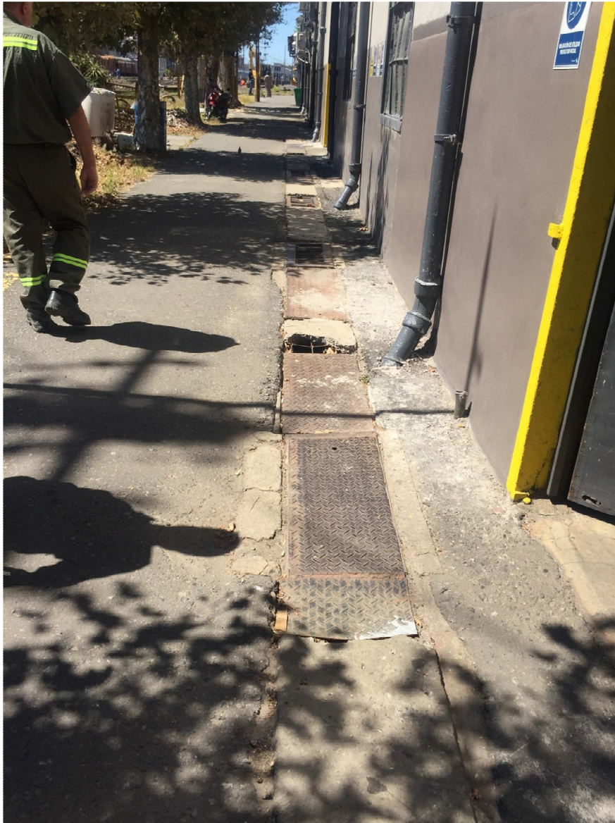
CAMINO EXTERIOR – TAPAS A REEMPLAZAR

ANEXO FOTOGRAFICO – MEJORAS EN TALLER COCHES RETIRO – FOSAS Y CAMINO EXTERIOR - LÍNEA SAN MARTÍN