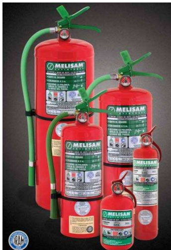
La imagen es solo ilustrativa.