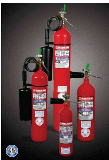
La imagen solo ilustrativa.