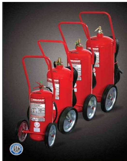
La imagen es netamente ilustrativa.