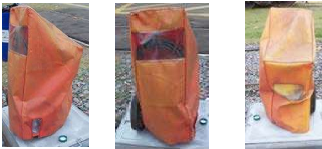
Fotografía N° 2 parte inferior contrapeso