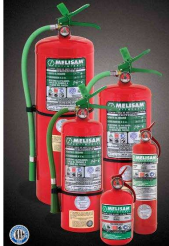
La imagen es solo ilustrativa.