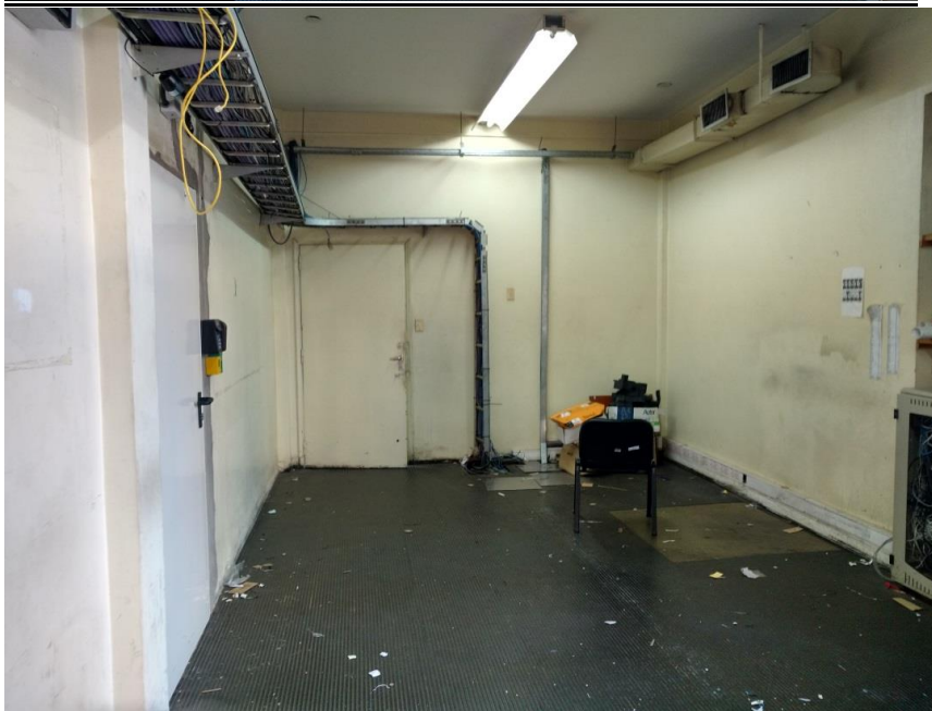
ANEXO FOTOGRAFICO - REFACCIÓN DE OFICINA DE SISTEMAS EN PALERMO – LINEA SAN MARTIN