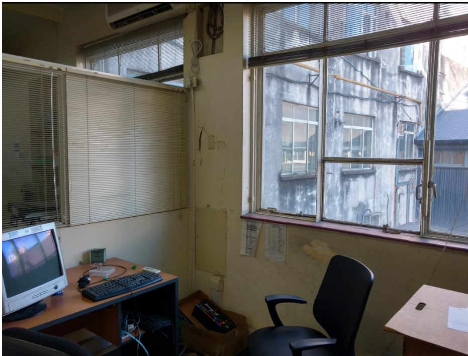
ANEXO FOTOGRAFICO - REFACCIÓN DE OFICINA DE SISTEMAS EN PALERMO – LINEA SAN MARTIN