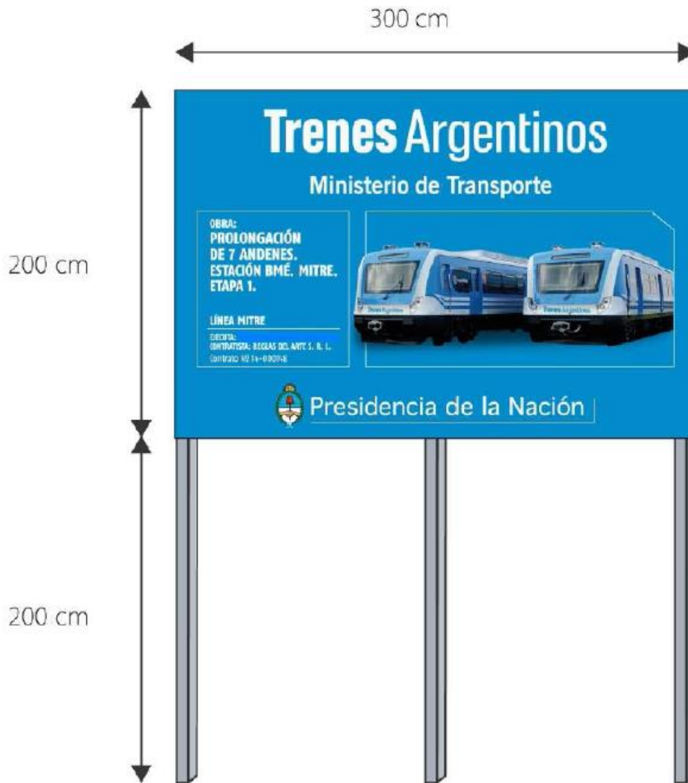
Diagrama técnico de la estructura del cartel