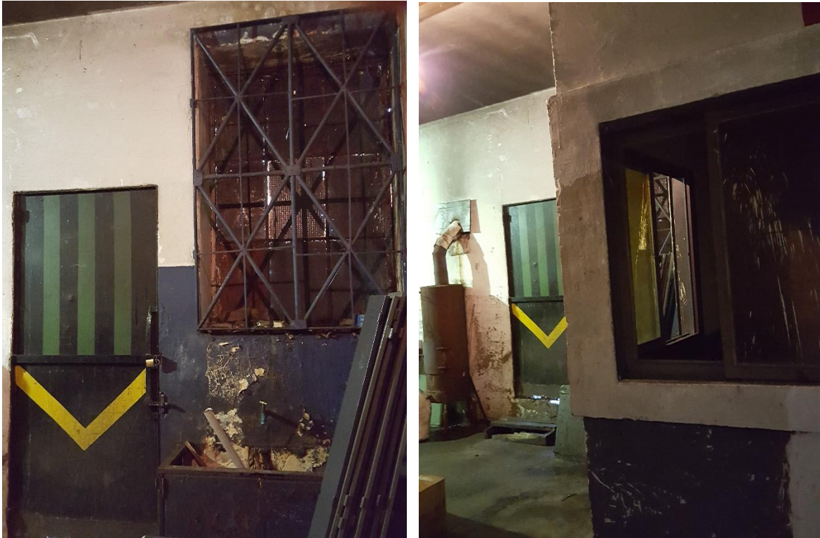
ANEXO FOTOGRAFICO - OBRA: AMPLIACION DE VESTUARIO FEMENINO AREA MATERIAL RODANTE TALLER VICTORIA