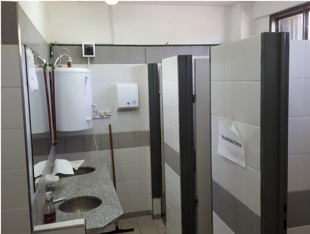
Vestuario Existente Damas

ANEXO FOTOGRAFICO - OBRA: AMPLIACION DE VESTUARIO FEMENINO AREA MATERIAL RODANTE TALLER VICTORIA