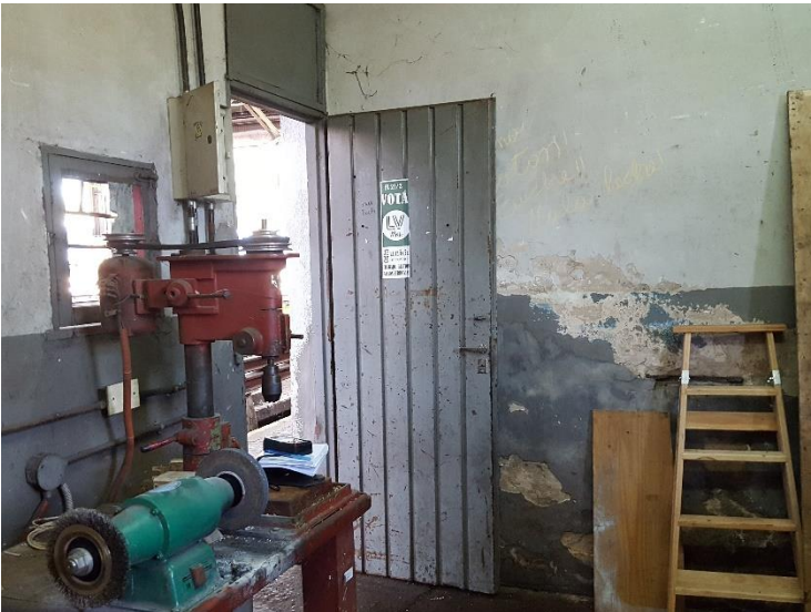
ANEXO FOTOGRAFICO - OBRA: AMPLIACION DE VESTUARIO FEMENINO AREA MATERIAL RODANTE TALLER VICTORIA