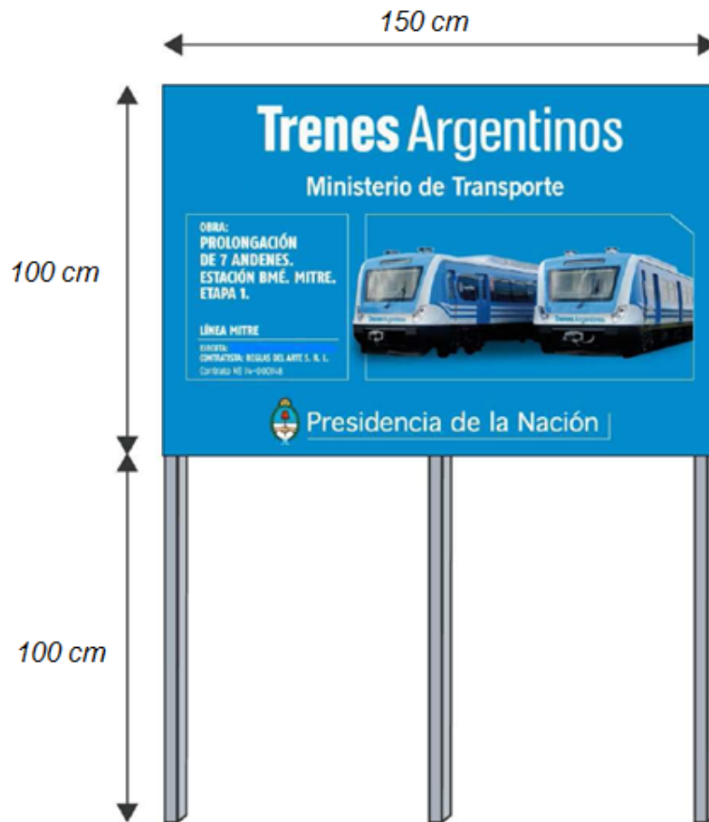
Diagrama técnico de la estructura del cartel