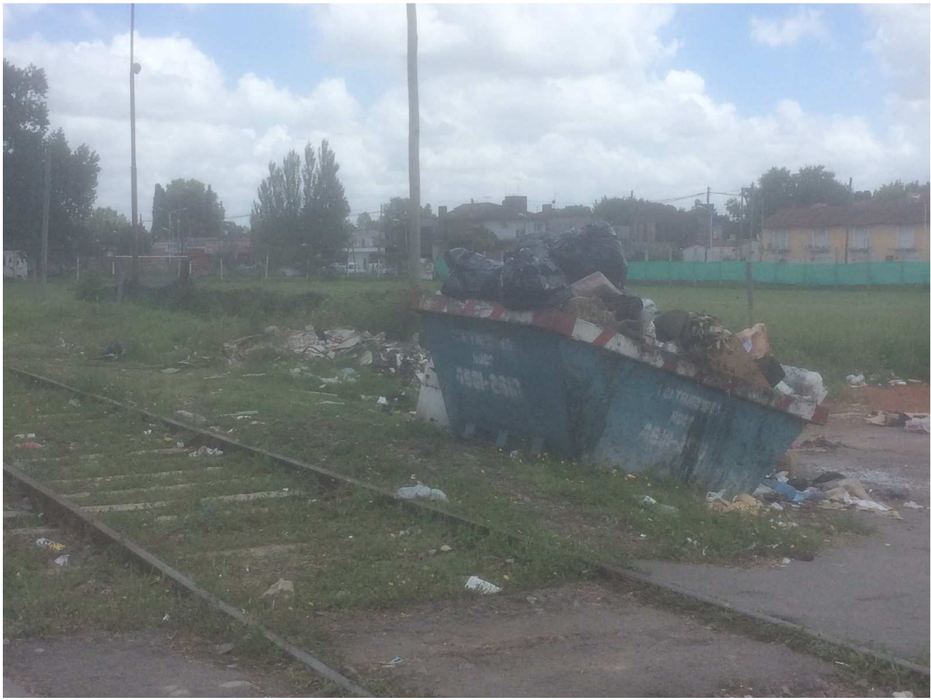
ANEXO FOTOGRAFICO - Obras de cierre y acceso a contenedores de basura en Estaciones Retiro, José C. Paz, Sol y Verde, Pte. Derquí y Pilar