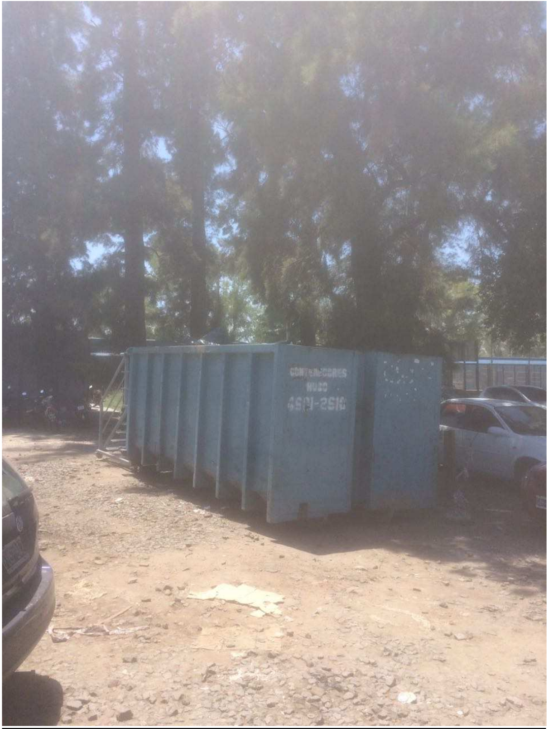
ANEXO FOTOGRAFICO - Obras de cierre y acceso a contenedores de basura en Estaciones Retiro, José C. Paz, Sol y Verde, Pte. Derquí y Pilar