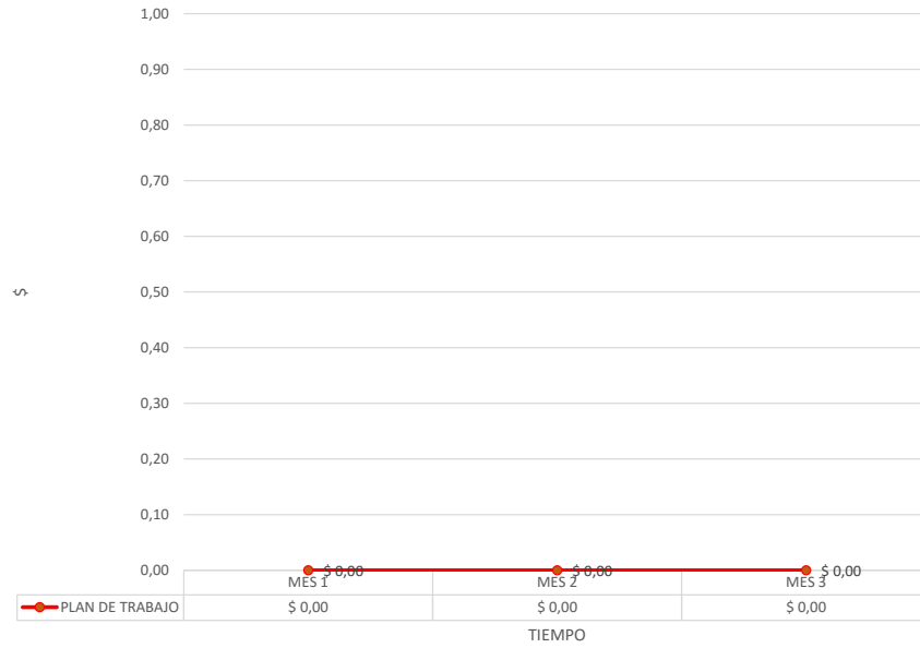
CURVA DE INVERSION PARCIAL