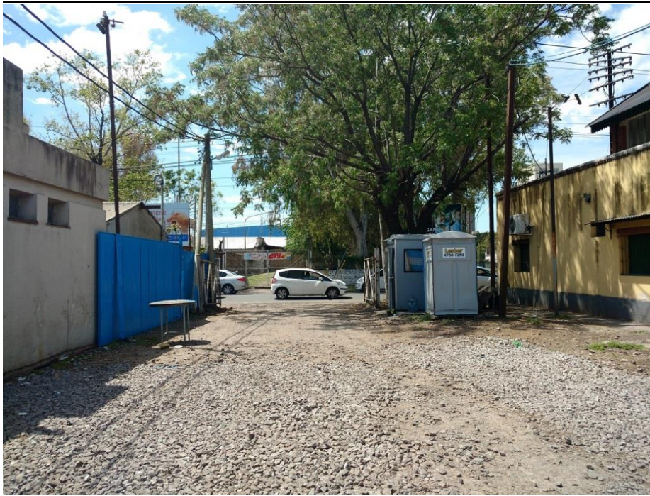
ANEXO FOTOGAFICO – CONSTRUCCIÓN DE CABINAS DE SEGURIDAD – PREDIO ALIANZA Y CASEROS – LÍNEA SAN MARTÍN