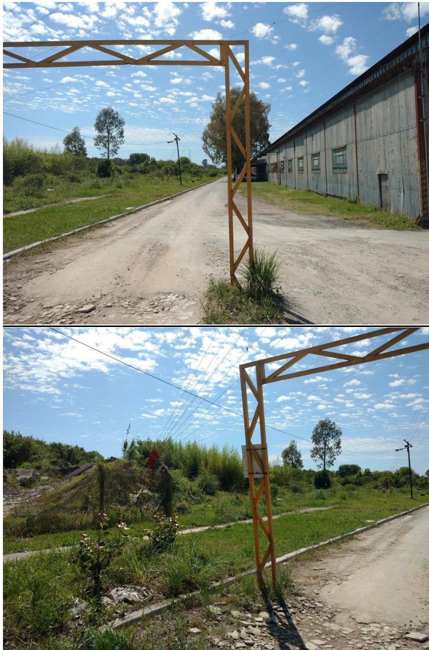
ANEXO FOTOGAFICO – CONSTRUCCIÓN DE CABINAS DE SEGURIDAD – PREDIO ALIANZA Y CASEROS – LÍNEA SAN MARTÍN