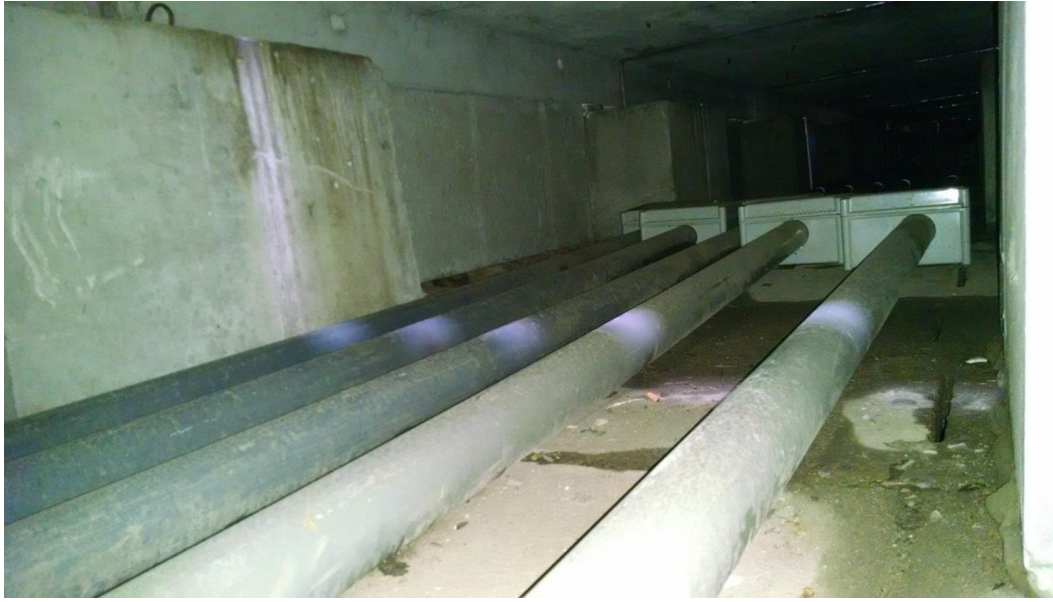
Módulos donde se deben realizar las aberturas