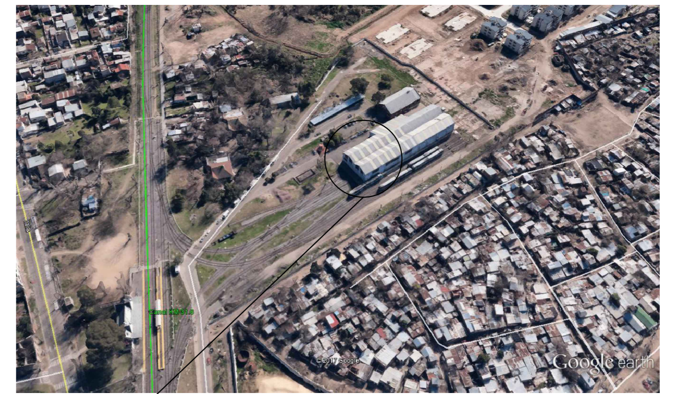
TALLER DE MATERIAL RODANTE A INTERVENIR