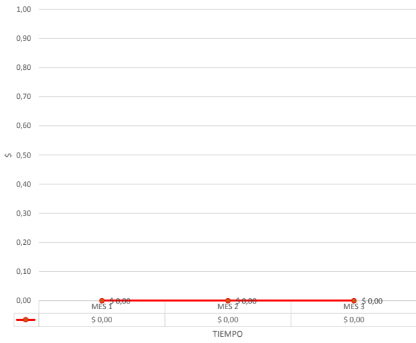
CURVA DE INVERSION PARCIAL