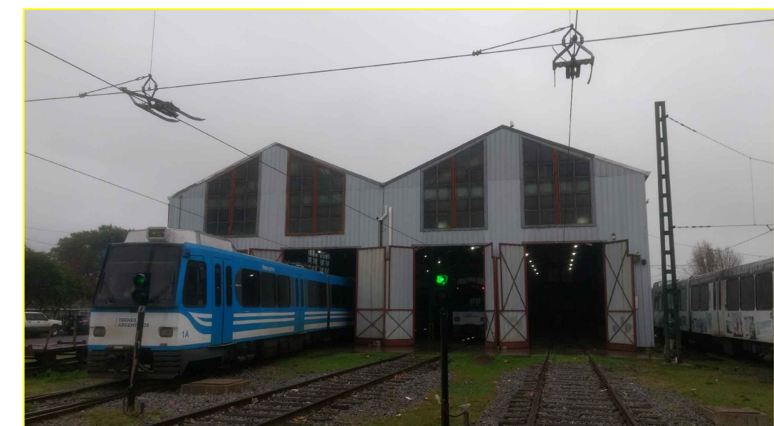
CARPINTERIAS A INTERVENIR - FRENTE DE TALLER M.R.