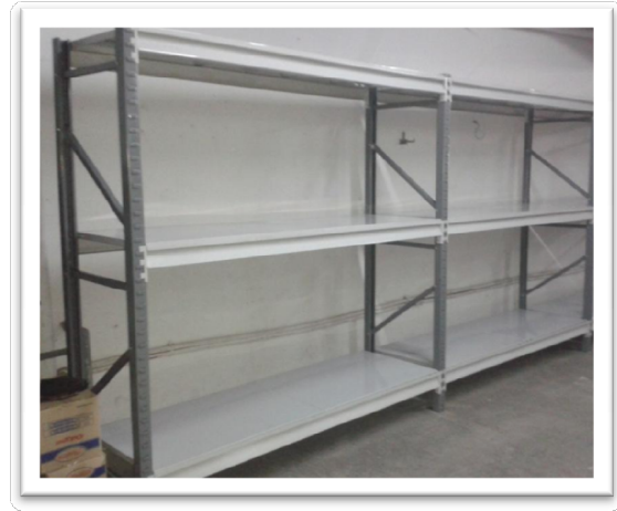
Figura 2. Rack armado.