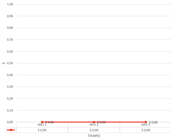
CURVA DE INVERSION PARCIAL