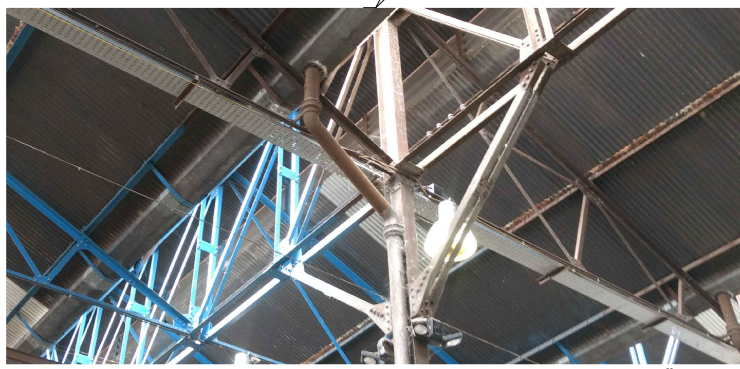
DETALLE DE DESAGÜE VERTICAL CON COLECTORA