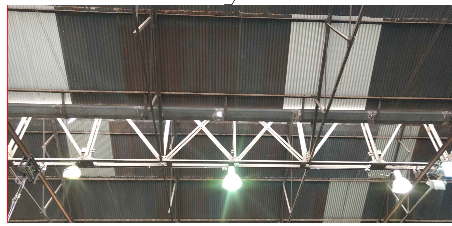
DETALLE DE CANALETAS