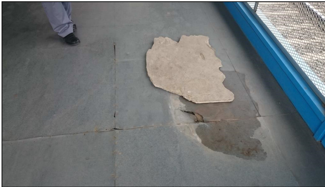
ANEXO FOTOGRÁFICO - MODIFICACIÓN DE PISOS EN MÓDULOS SUBE/BOLETERIA – ESTACIÓN MUÑIZ