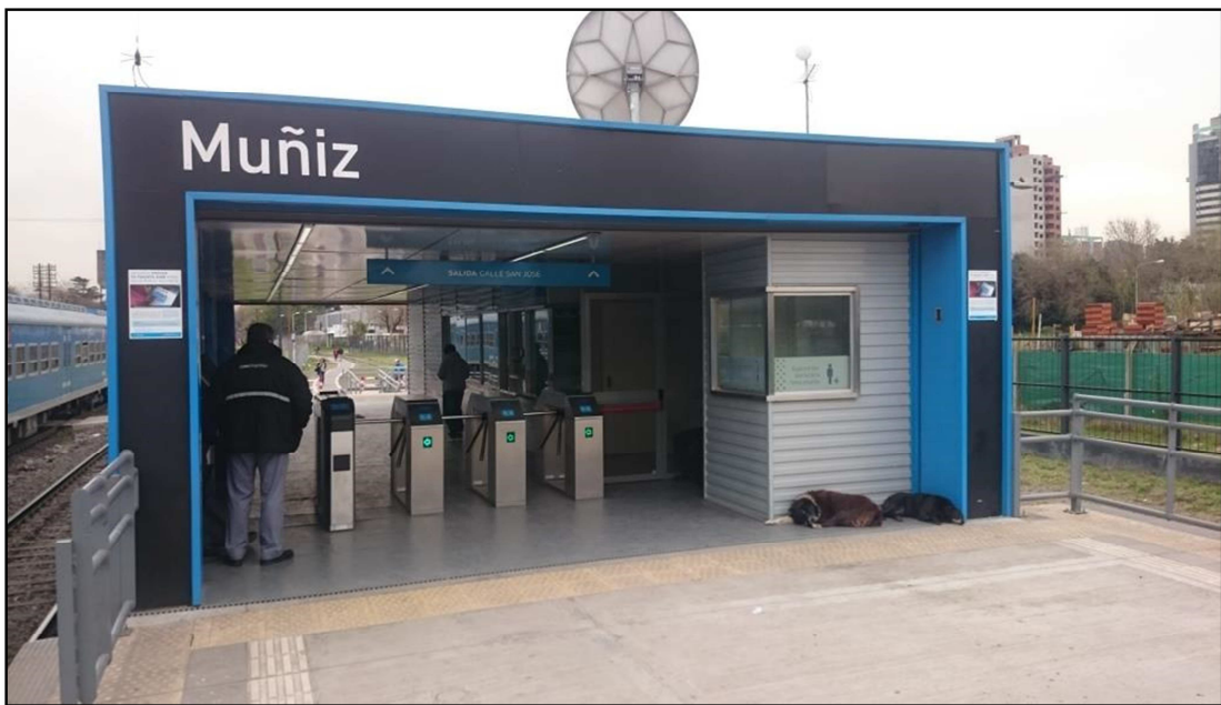
ANEXO FOTOGRÁFICO - MODIFICACIÓN DE PISOS EN MÓDULOS SUBE/BOLETERIA – ESTACIÓN MUÑIZ