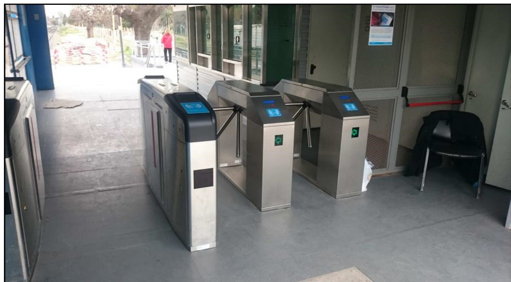
ANEXO FOTOGRAFICO - MODIFICACIÓN DE PISOS EN MÓDULOS SUBE/BOLETERIA – ESTACIÓN MUÑIZ