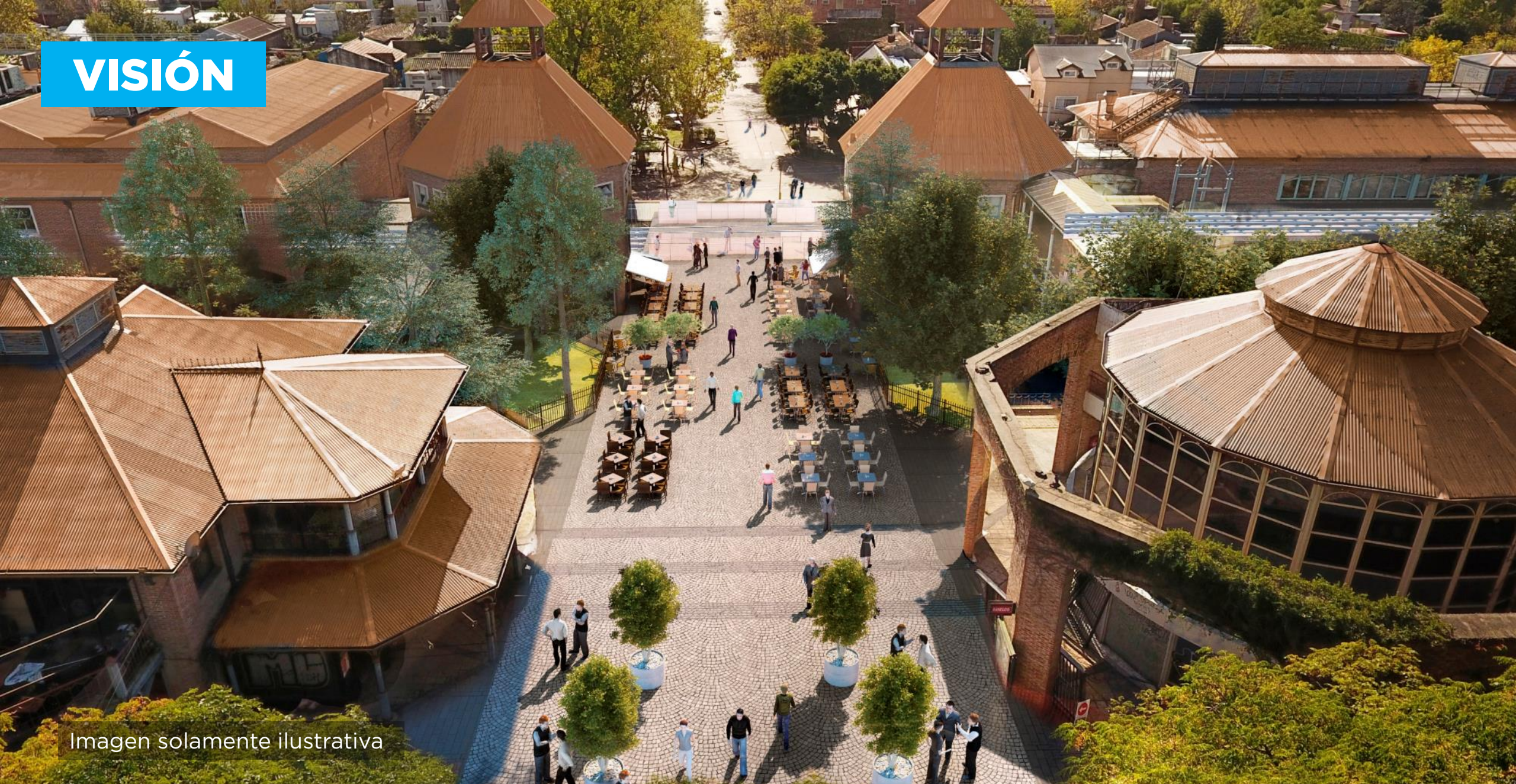
Imagen solamente ilustrativa