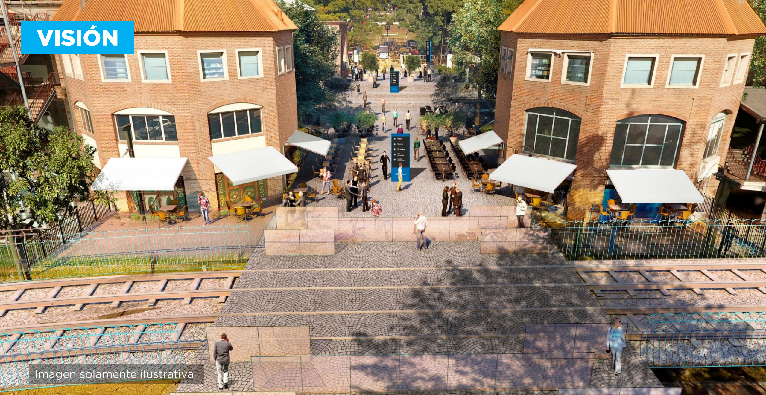
Imagen solamente ilustrativa