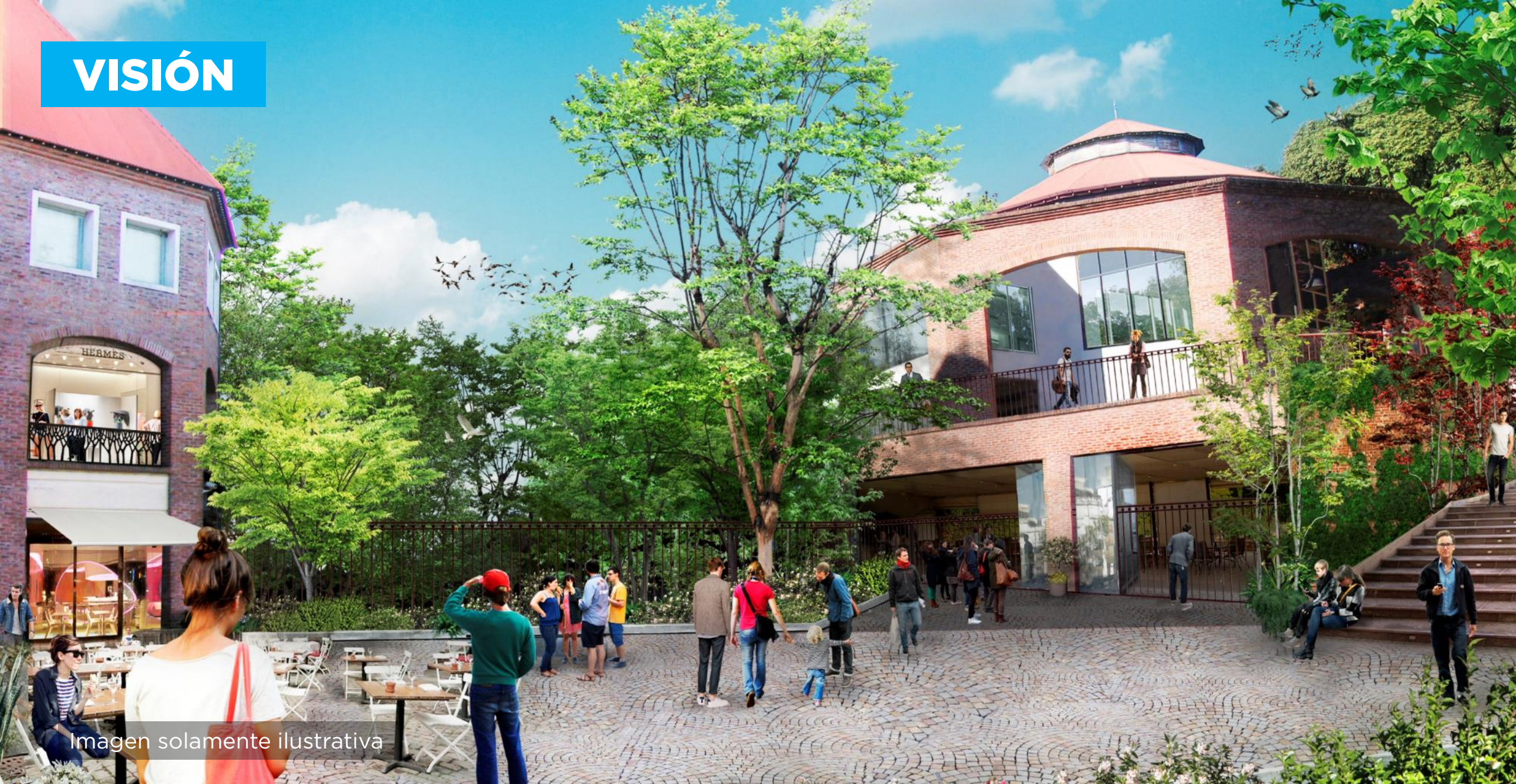
Imagen solamente ilustrativa