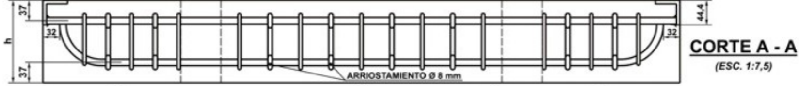
CORTE A - A (ESC. 1:7,5)