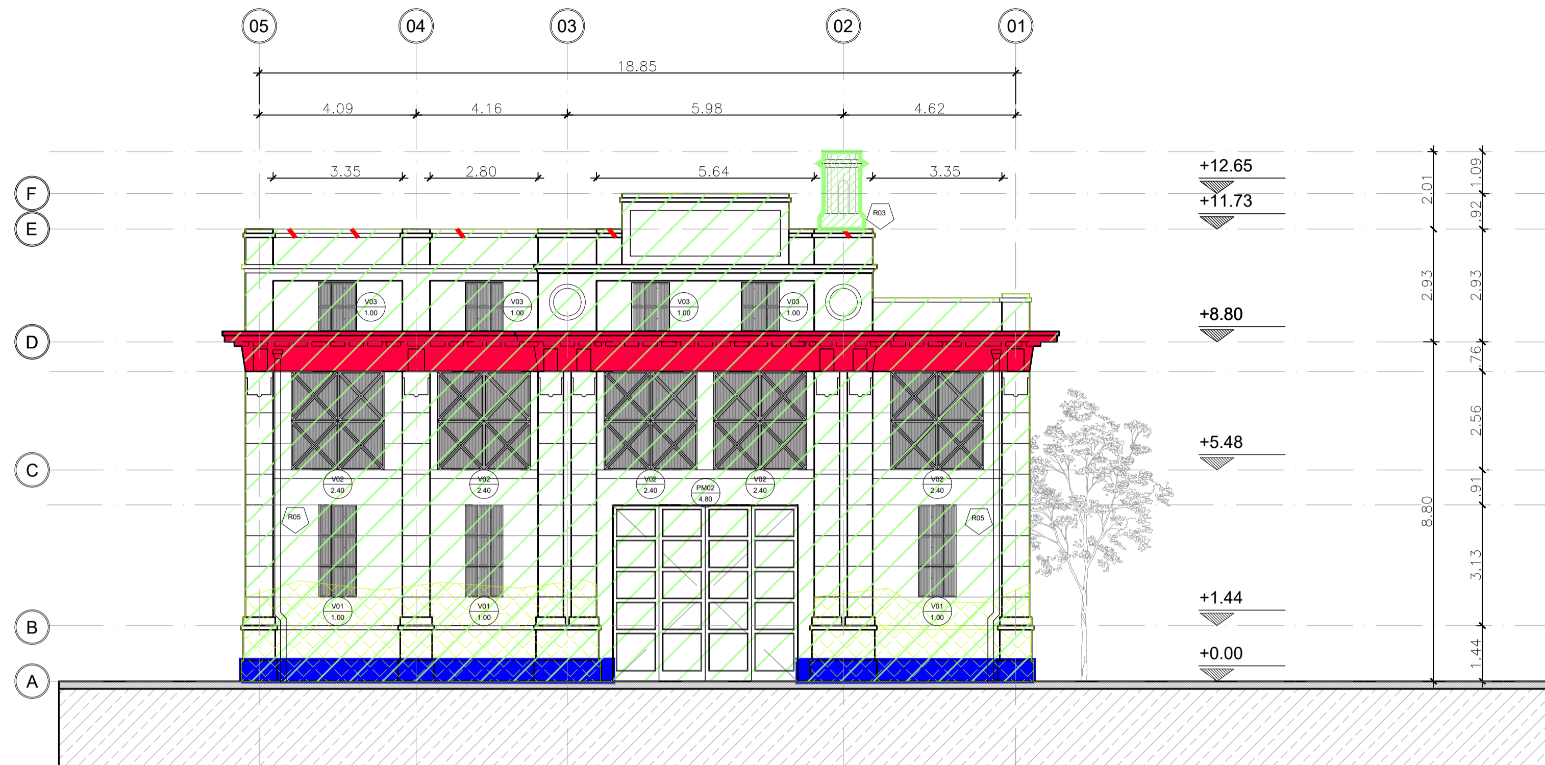
SUBSTACION RECTIFICADORA CASTELAR - VISTA OESTE