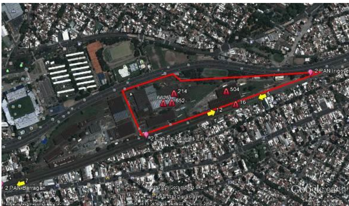
1 Talleres Liniers y Villa Luro